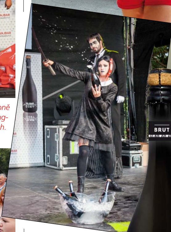
Wednesday „Středa“ Addams měla nový zážitek. Místo živých bytostí tentokrát stala láhev.